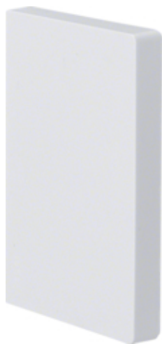
tehalit.BRP Końcówka 65x100, biała