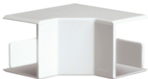
tehalit.LF/ateha Kąt wewnętrzny 40x40mm biały